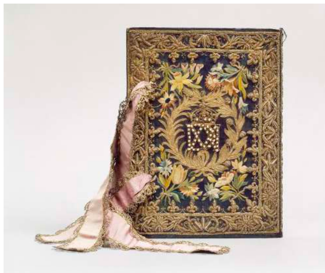
Reliure en soie brodée d'or au chiffre de Marie de Médicis (1575-1642) Paris, 1629 Chantilly, cabinet des livres, manuscrit 537 (Vie de saint Denis)