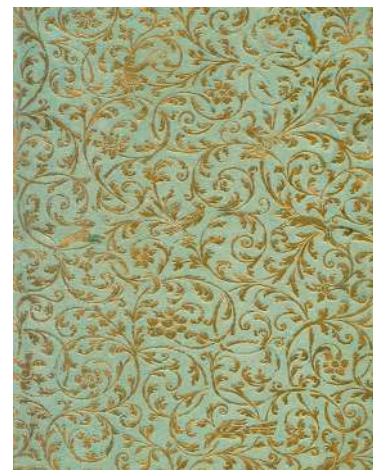
Papier doré et gaufré utilisé en page de garde, XVIII e siècle Chantilly, cabinet des livres