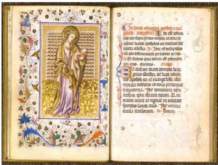
Enluminures rehaussées d'or. Recueil de prières, Italie, XV e siècle (vers 1420) Chantilly, cabinet des livres, manuscrit 100 Cliché IRHT-CNRS

Parmi les raretés présentées, des imprimés à l'encre dorée étonnent comme des Évangiles imprimés en lettres d'or sur papier porcelaine, provenant de la bibliothèque du roi Louis Philippe à Neuilly (1836), sans oublier la Déclaration des droits de l'homme dans une belle édition de la première Constitution, en 1792. L'importance prise par la dorure et l'or n'est pas que somptuaire : elle est toujours significative d'un caractère symbolique.