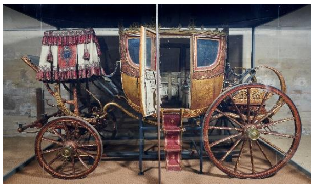
Berline de gala, 1825 - Nef Ouest des Grandes Écuries du Château de Chantilly

À l'instar de la voiture du Roi, celle du duc de Bourbon était « attelée à huit » : les chevaux bais étaient équipés d'harnachements en cuir noir orné d'éléments en bronze doré au mercure. Une deuxième voiture attelée à huit pour ses officiers suivait le cortège. Le prince passa commande de ces seize harnais auprès du sellier Richard pour un total de 62 928 francs.