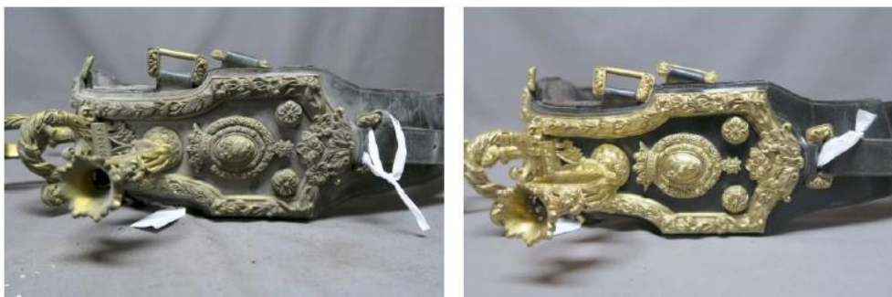
Selle avant/après restauration cuir et métal

L'espace muséal ne permettant pas d'exposer les huit harnais sur mannequins aux côtés de la riche berline de gala, une vitrine sur mesure a été aménagée. Une fois leur restauration achevée, les quatre derniers harnais y seront présentés sur des socles métalliques.