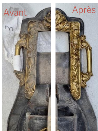
Boucle en cours de restauration métal