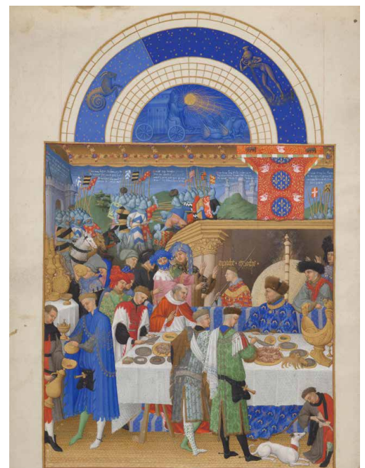
Januari, in de Kalender van Les Très Riches Heures du Duc de Berry Paris en Bourges, 1411 - 1485

In december 1855 dook in Genua een manuscript op dat toebehoorde aan hertog Jan van Berry (1340-1416), zoon, broer en oom van Franse koningen. Het werd onder de aandacht gebracht van Henri d'Orléans, hertog van Aumale (1822-1897), die onmiddellijk het uitzonderlijke karakter ervan herkende, het direct kocht en het samen met de beste geleerden van die tijd begon te bestuderen. Naast dit manuscript maken andere essentiële stukken uit hetzelfde atelier het mogelijk om een inspirerend panorama te schetsen en deze unieke productie in zijn context te plaatsen.