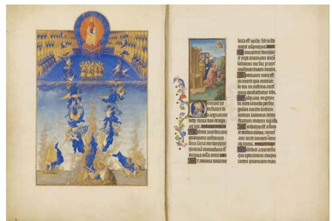
De Val van de Engelen, in Les Très Riches Heures du Duc de Berry, Paris en Bourges, 1411 - 1485