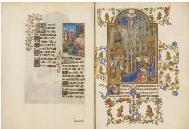
De Kerstmis, in Les Très Riches Heures du Duc de Berry, Paris en Bourges, 1411 - 1485

De restauratie, begeleid door de grootste experts, bood de mogelijkheid om analyses uit te voeren die nog nooit eerder op het werk waren gedaan, om elke fase van de creatie en elke penseelstreek te begrijpen. Het verslag van uitzonderlijke ontdekkingen en de wetenschappelijke beeldvorming van de analyses, uitgevoerd door het C2RMF, zullen worden gepresenteerd in een audiovisuele weergave.