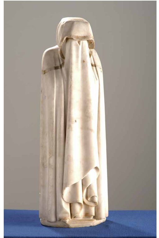
Jean de Cambrai, 'Treurende' van de hertog van Berry, Bourges, museum van Berry

Via literatuur, beeld en film biedt de tentoonstelling enkele inzichten in de redenen en de omvang van de roem van het manuscript tot op de dag van vandaag.