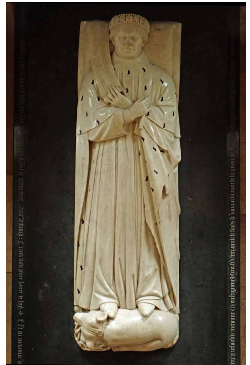
Jean de Cambrai, Ligbeeld van de hertog van Berry, Kathedraal van Bourges