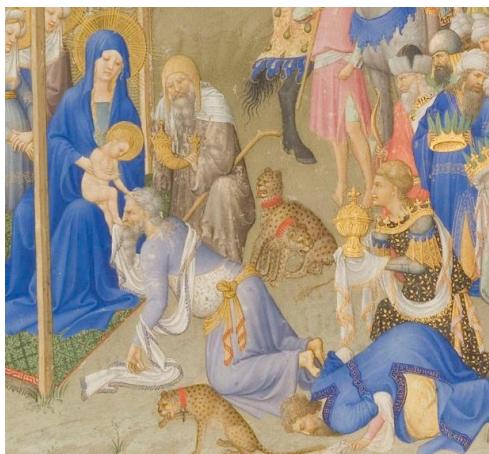
Détail (page de droite)

Ces grandes peintures des frères Limbourg ont été peintes sur deux feuillets isolés entre 1411 et 1416.