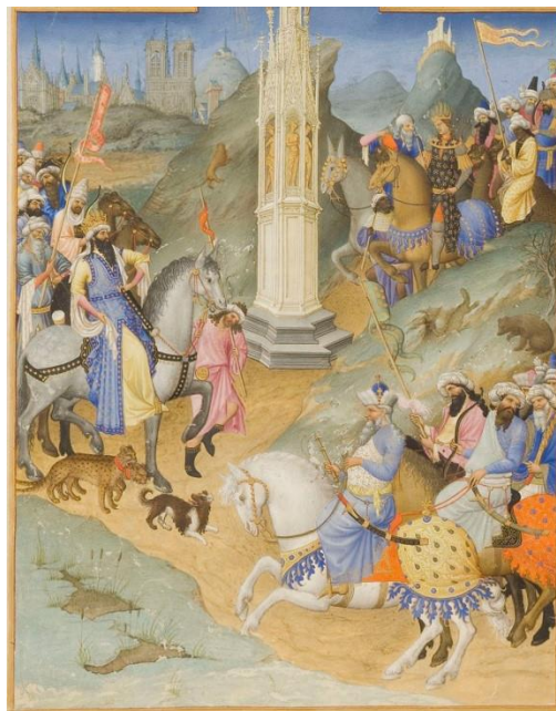
Vue de la page de gauche

À l'arrière-plan de l'Adoration, on distingue une ville qui devrait être Bethléem mais ressemble à la silhouette de Bourges.