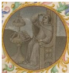
Médaille, page de droite

À droite, les médaillons disposés sur le pourtour de la page permettent aux Limbourg d'agrandir l'espace pictural et de représenter les événements qui accompagnent la mort du Christ dans les évangiles : un astrologue observe le soleil qui se voile, le rideau du Temple de Jérusalem se déchire, des morts ressuscitent.