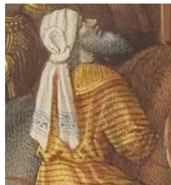
Détail de la page de gauche

Selon la légende, le crâne et les ossements qui jonchent le sol sont ceux d'Adam, déterrés lors de la fixation de la Croix en terre.