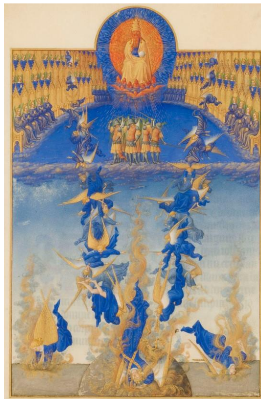
Vue de la page de gauche, Frères de Limbourg, 1411-1416

Étymologiquement, «séraphin» signifie «ceux qui brûlent». Sous-entendu, ceux qui brûlent d'un amour divin. C'est un motif fréquent dans la peinture et l'enluminure de la fin du Moyen Age.