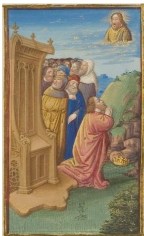
Détail de la page de droite, Jean Colombe, vers 1485

Cette double page a la particularité d'avoir été peinte par plusieurs artistes tout au long du XV e siècle.