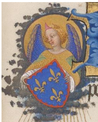
Médailon (détail page de droite)

Réalisée entre 1411 et 1416 par les frères Limbourg, cette peinture ainsi que les médaillons qui l'entourent font partie des Heures de l'année liturgique, en l'honneur de la fête de Saint-Michel, célébrée le 29 septembre.