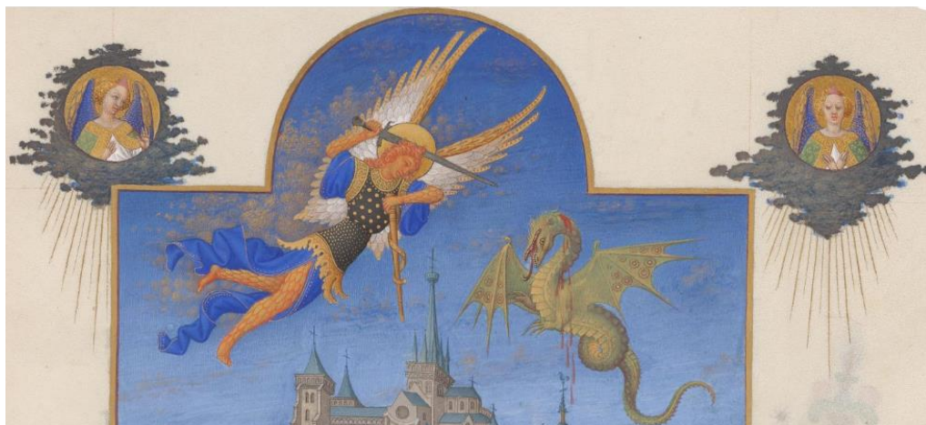
Détail - page de droite

La figure de saint Michel reprend celle de l'archange au centre du panneau représentant la Chute des anges rebelles , peint dans l'entourage de Simone Martini entre 1340 et 1345 et aujourd'hui conservé au musée du Louvre, à Paris.