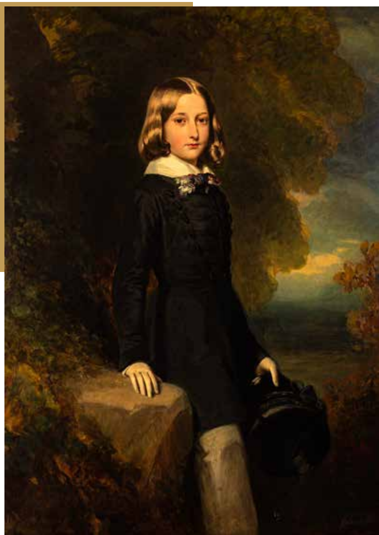
Franz Xaver Winterhalter Léopold, duc de Brabant 1844, huile sur toile, H. 142 cm ; L. 101 cm Belgique, Collection royale, inv. 0107(1)TA