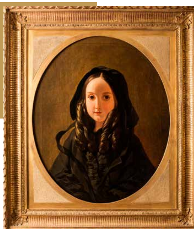
Atelier Franz Xaver Winterhalter Charlotte de Belgique Vers 1844, huile sur toile, H. 63 cm ; L. 71 cm Bruxelles, musée BELvue, fonds musée de la Dynastie, inv. A2200