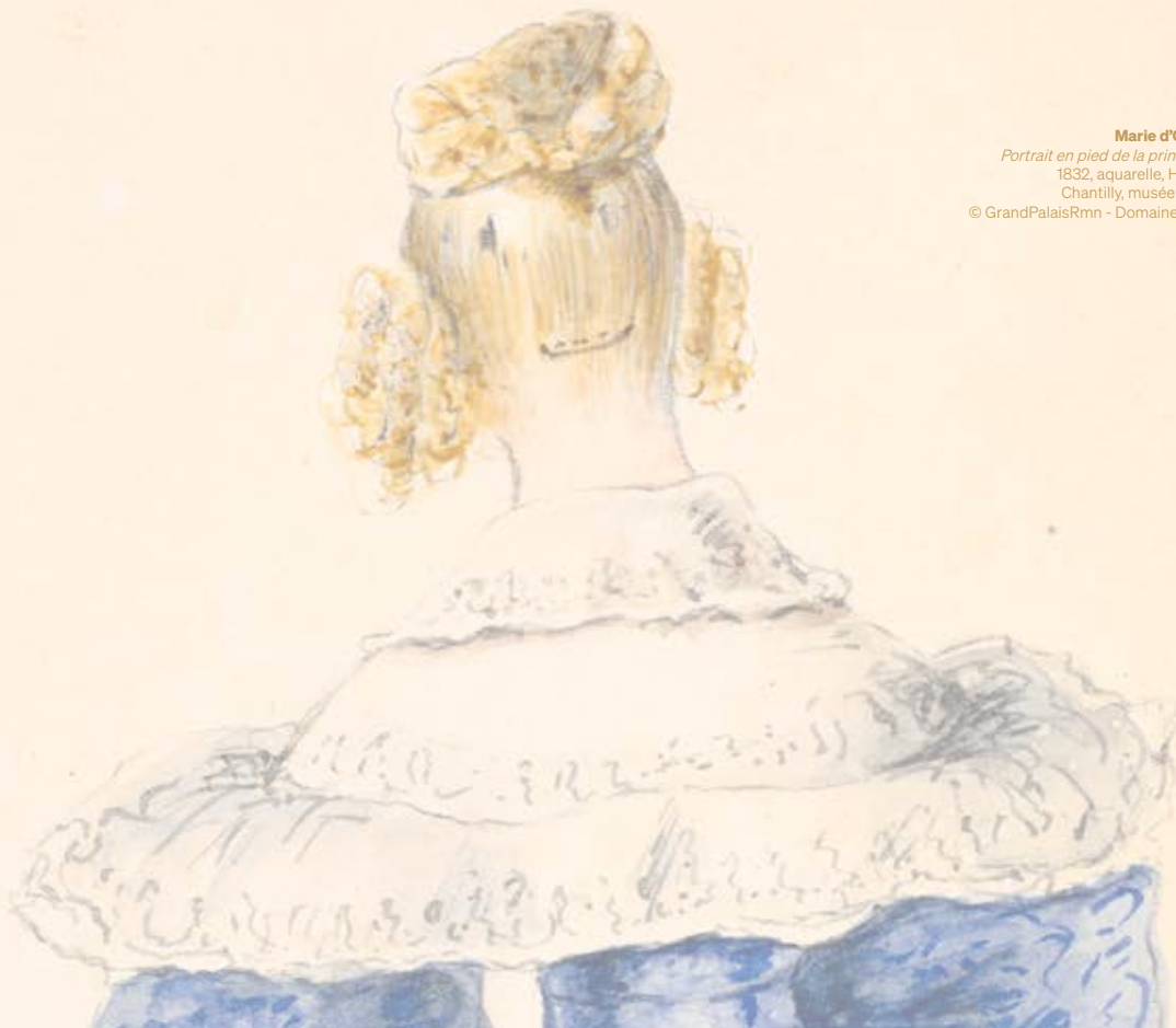
Marie d'Orléans Portrait en pied de la princesse Louise vue de dos 1832, aquarelle, H. 17 cm ; L. 9 cm Chantilly, musée Condé, PD 505