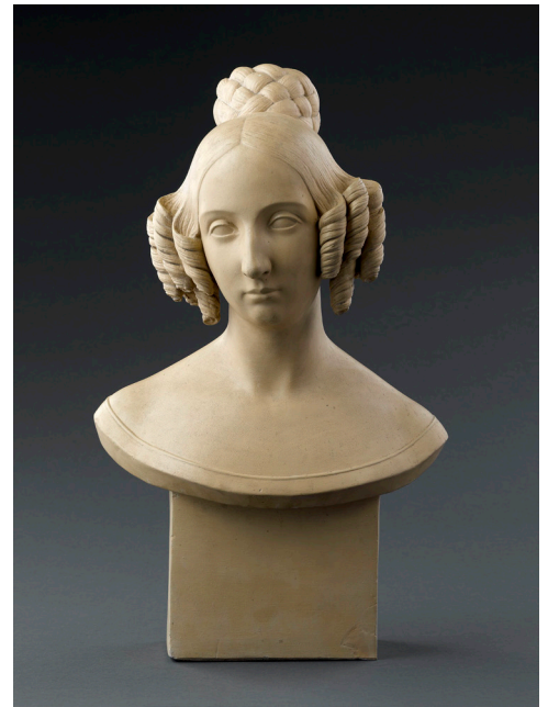
Marie d'Orléans, Buste van Louise d'Orléans, Koningin der Belgen, Musée Condé

De opdracht van de Service des Musées et du Patrimoine culturel bestaat erin het roerend of onroerend, materieel of immaterieel cultureel erfgoed van de provincie Namen te vrijwaren, te promoten en te ontwikkelen. Naast een eenheid die verantwoordelijk is voor het promoten van dit cultureel erfgoed in de hele provincie en via de erfgoed sites in alle gemeenten, omvat de dienst twee musea met internationale faam: het TreM.a-museum voor Oude Kunst, dat collecties uit de late middeleeuwen en de vroege renaissance tentoonstelt en promoot (waaronder de beroemde Trésor d'Oignies), en het Musée Félicien Rops, een monografisch museum dat de geschiedenis en Belgische kunstenaars uit de XIX eeuw belicht.