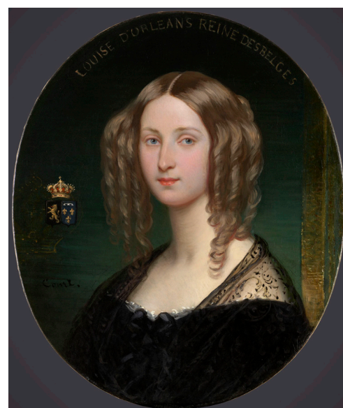
Joseph Désiré Court, Portrait de la princesse Louise d'Orléans, reine des Belges , musée Condé

L'exposition consacrée à cette figure féminine méconnue la remettra à l'honneur auprès d'un large public, autant en France qu'en Belgique, grâce à un partenariat transfrontalier exceptionnel faisant sortir des réserves de véritables chefs-d'œuvre très souvent inconnus, issus de prestigieuses collections, notamment celle de la Donation royale de Belgique.