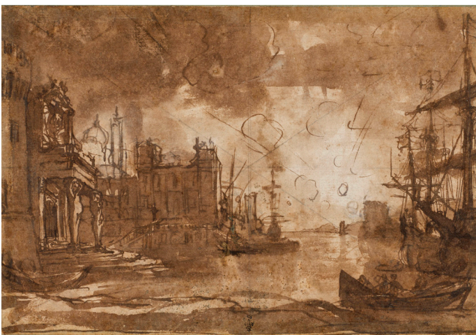
Claude Gellée, dit le Lorrain (Chamagne, vers 1600 – Rome, 1682) Port de mer au soleil couchant Vers 1635-1640

Plume et encre brune, lavis brun, légers rehauts blancs, mise au carreau diagonale à la pierre noire sur papier vergé (doublé) 13,9 × 20,3 cm