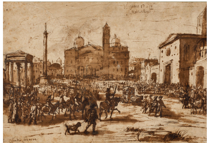
Claude Gellée, dit le Lorrain (Chamagne, vers 1600 – Rome, 1682) Bénédition des chevaux à Rome devant Santa Maria Maggiore Vers 1635-1640

Cette composition peut être mise en relation avec – et précède – une feuille conservée au British Museum qui représente l'une des premières scènes portuaires peintes par Claude pour le pape Urbain VIII (1568-1644).