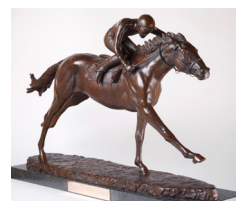
Kahyasi, David Wynne, 1988