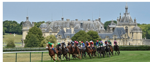
Prix de Diane de 2012

En juillet 2023, France Galop a offert en dépôt vingt peintures et objets d'art au musée vivant du Cheval. Ainsi, de magnifiques trophées et portraits de chevaux devant les Grandes Écuries pourront rejoindre l'accrochage de la salle.