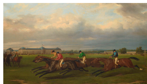
Courses du mois de mai 1836 à Chantilly, Pierre Vernet © RMN-Grand Palais (Domaine de Chantilly) Adrien Didierjean

Nous souhaitons valoriser l'histoire des courses à travers l'exposition de chefs-d'œuvre de nos collections dans cette salle.