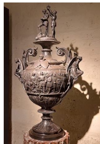
Ascot Gold Cup, 1874, dépôt de France Galop