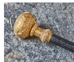
Cravache, Chantilly, 1835