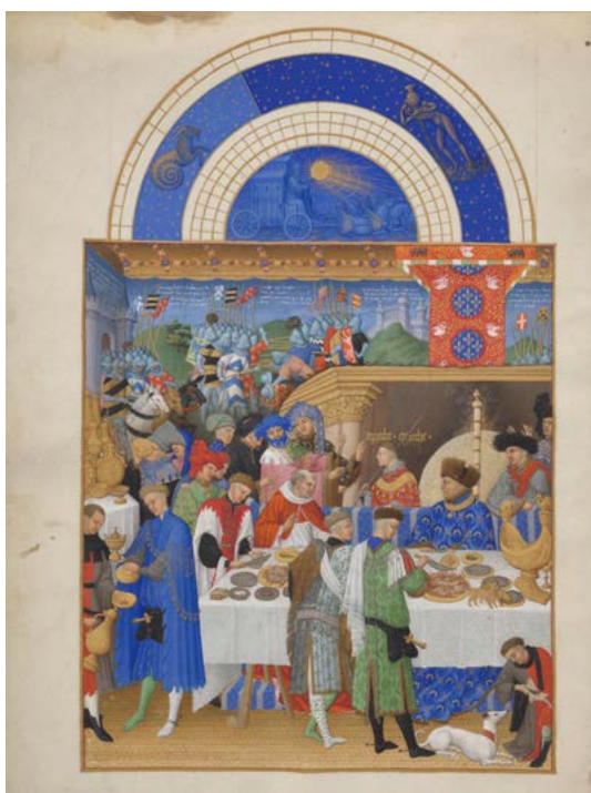
Calendrier de janvier