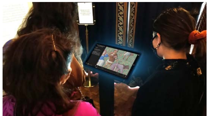
Borne dans le cabinet des livres