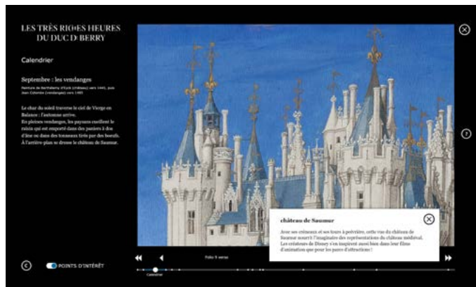
Calendrier de septembre