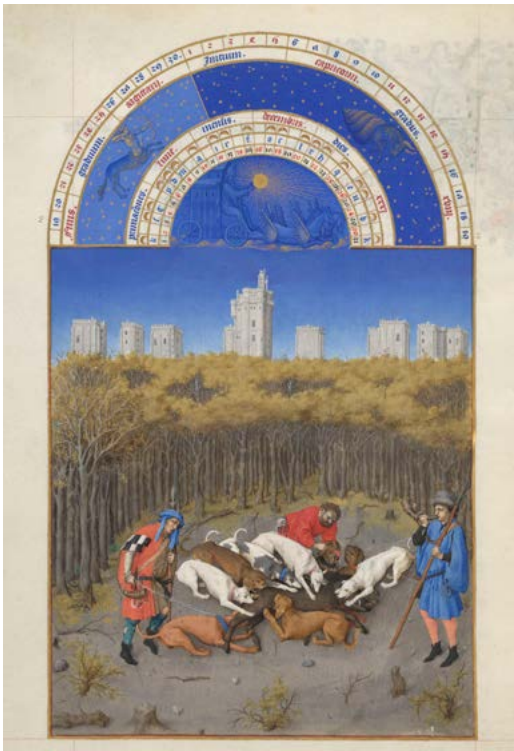
Calendrier de décembre

Le calendrier est sans doute l'ensemble de miniatures le plus célèbre du livre, si ce n'est de toutes les enluminures du Moyen Âge. Pour la première fois, chaque mois occupe deux pages et est illustré d'une grande miniature : scènes paysannes et fêtes princières se succèdent devant le duc de Berry lui-même, ou devant les châteaux qu'il a habités ou possédés.