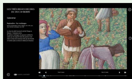
Calendrier de septembre, scène de vendanges (appli sur borne)